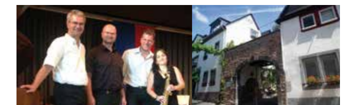
Kunsttage-Party Weingut Fries, Bachstraße 66